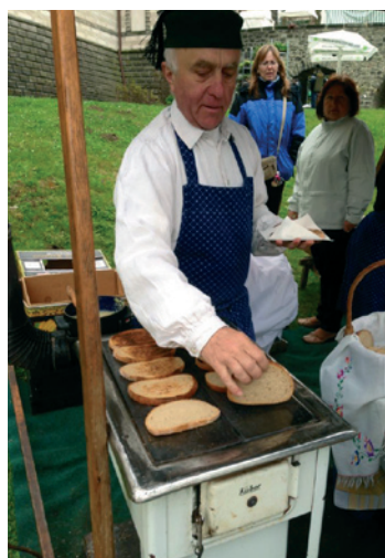
Prodavač tradičních topinek s česnekem

Letošní program zahrnoval prohlídky zámku, ukázky sokolnictví a dobových her, koncerty, divadelní představení a řemeslné dílny pro děti.