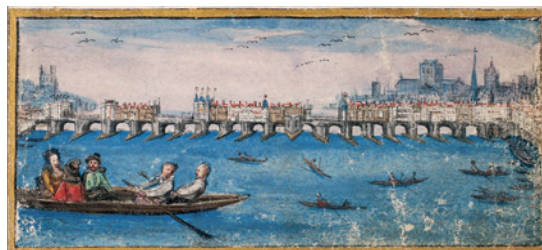
Památník Georga Leopolda von Stadl z počátku 17. století: Londýn – pohled na London Bridge (malováno 1611)

Výstava na zámku Nelahozeves potrvá od dubna 2013 do 31. října 2013.