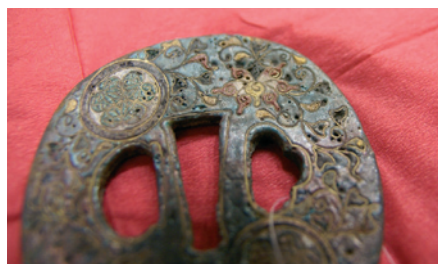
Cuba, kolem 1840, výrobce neznámý, Japonsko, železo a měď, technika cloisonné

Je to stará záštitka meče, pravděpodobně vyrobená školou Hirata za použití techniky cloisonné. Její hlavní funkcí je vyvažovat meč, ale domníváme se, že byla vyrobena pro ceremoniální účely, protože pro boj je příliš tlustá a těžká.