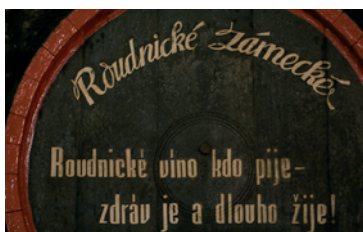
Roudnice Lobkowicz Winery

Srdečně Vás zveme na degustaci lobkowických vín! Naplánujte si v létě cestu do malebného města Roudnice nad Labem a ochutnejte s námi lobkowická vína. Od roku 1603, kdy bylo Lobkowické zámecké vinařství založeno, si roudnická vína svou charakteristickou chutí a vůní